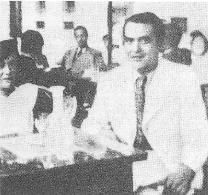
Letztes bekanntes Foto von García Lorca (Juli 1936 in Madrid)