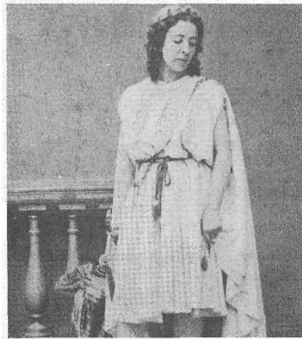
Pauline Viardot in der Titelpartie von Glucks «Orpheus»

Zeit. Seine berühmteste Schülerin war seine 1808 geborene Tochter Maria Malibran. Pauline Viardot hatte neben dieser Schwester auch noch einen Bruder, den 1805 geborenen Manuel. Manuel Garcia, der 101jährig wurde, war der be-