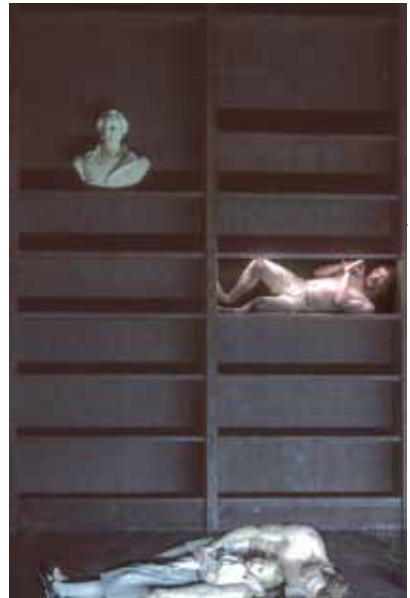
« Jakob Lenz » de Wolfgang Rihm, mise en scène d'Andrea Breth.

Jakob Lenz de Wolfgang Rihm (Bruxelles, Théâtre royal de la Monnaie, 27 février – 7 mars 2015)