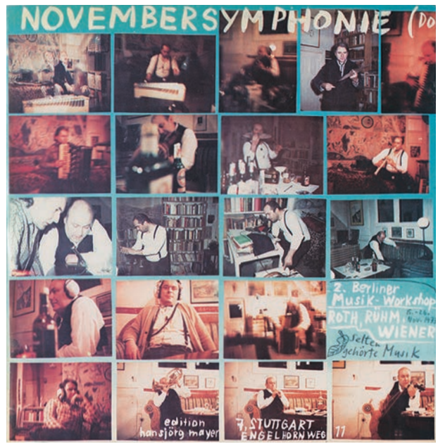
Image 3: Selten gehörte Musik, Novembersymphonie, 1973, couverture © Dieter Roth Estate, Courtesy Hauser & Wirth

Un tel dévoilement de la réalité est présent dans le deuxième vinyle de musique rarement entendue , l'album Novembersymphonie ( Symphonie de novembre ) (voir image 3). Il fut enregistré deux ans avant le Romentalquartett, en novembre 1973 à Berlin. Pour le genre symphonique, le groupe était également bien en selle et conçut une forme en quatre mouvements: le dernier mouvement s'appelle Subito ( 72 Bagatellen ), où l'on entend distinctement les références à l'École de Vienne, la seconde et la « première » (extrait audio 2). Il s'agit de fragments d'une improvisation enregistrée dans l'apparte-