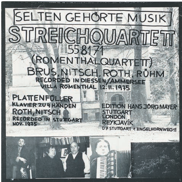
Image 1: Selten gehörte Musik, Romenthalquartett, 1975, couverture