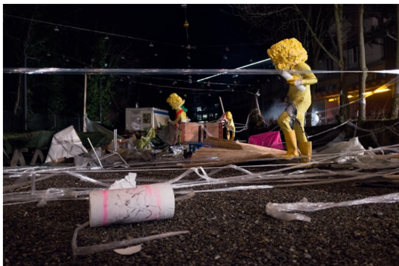
Skurriler Pausenauftritt in der Gessnerallee.